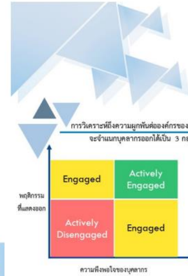
ผลคะแนนความผูกพันของพนักงาน ลูกจ้าง ทอท. ประจำปี 2565