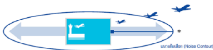
ภาพที่ 3 แผนภาพขนาดพื้นที่ภายใต้เกณฑ์การประเมินผลกระทบด้านเสียงจากอากาศยาน

1.3. หลักเกณฑ์ที่ 3: การประเมินผลกระทบด้านเสียงจากอากาศยาน กำหนดให้ผู้ปฏิบัติงานด้านความรับผิดชอบต่อสังคมของ ทอท. พิจารณาการเชื่อมโยงกับชุมชนจากระยะทางที่แตกต่างกันในแต่ละท่าอากาศยาน ขึ้นอยู่กับจำนวนอากาศยาน ชนิดของอากาศยาน สัดส่วนการใช้ทางวิ่งและทิศทางการขึ้น - ลงของอากาศยาน เช่น ท่าอากาศยานสุวรรณภูมิ (ทสภ.) ครอบคลุมพื้นที่ด้านตะวันออกและตะวันตก ด้านละประมาณ 1 กิโลเมตร และด้านเหนือและใต้ ประมาณ 10 กิโลเมตร จากขอบพื้นที่ท่าอากาศยาน ท่าอากาศยานดอนเมือง (ทดม.) ครอบคลุมพื้นที่ด้านตะวันออกและตะวันตก ด้านละประมาณ 1 กิโลเมตร และด้านเหนือและใต้ ประมาณ 11 กิโลเมตร จากขอบพื้นที่ท่าอากาศยาน ท่าอากาศยานภูเก็ต (ทภก.) ครอบคลุมพื้นที่ด้านตะวันออกและตะวันตก ด้านละประมาณ 5 กิโลเมตร และด้านเหนือและใต้ ประมาณ 1.5 กิโลเมตร จากขอบพื้นที่ท่าอากาศยาน โดยหลักเกณฑ์การประเมินผลกระทบด้านเสียงจากอากาศยานนี้เป็นไปตามแนวทางการจัดการมลพิษทางเสียงของท่าอากาศยานแบบสมดุล ฉบับปี 2008 ขององค์การการบินพลเรือนระหว่างประเทศ (ICAO: International Civil Aviation Organization)